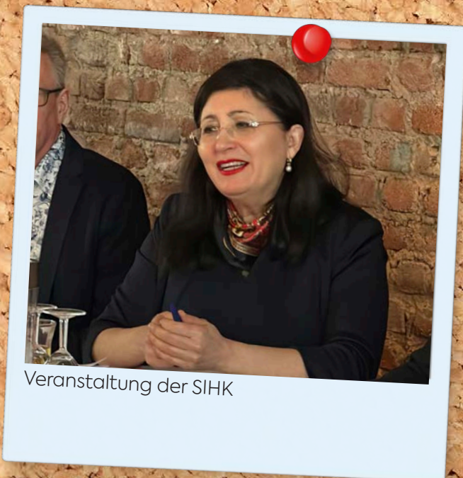
Veranstaltung der SIHK