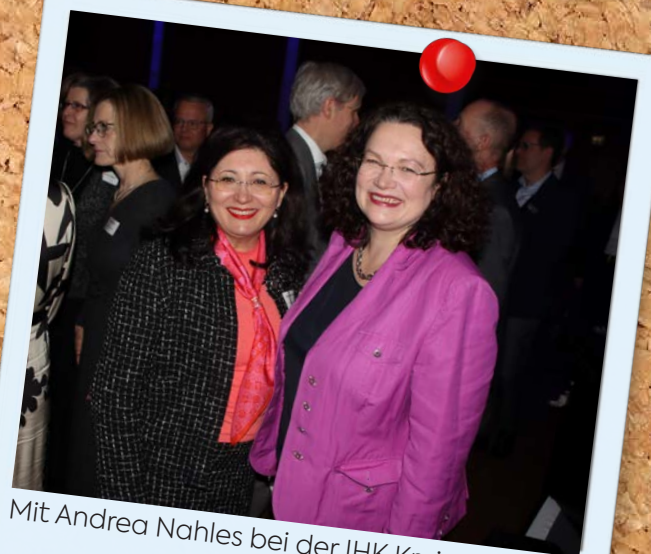
Mit Andrea Nahles bei der IHK Kreis Olpe