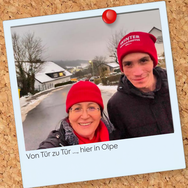
Von Tür zu Tür .... hier in Olpe