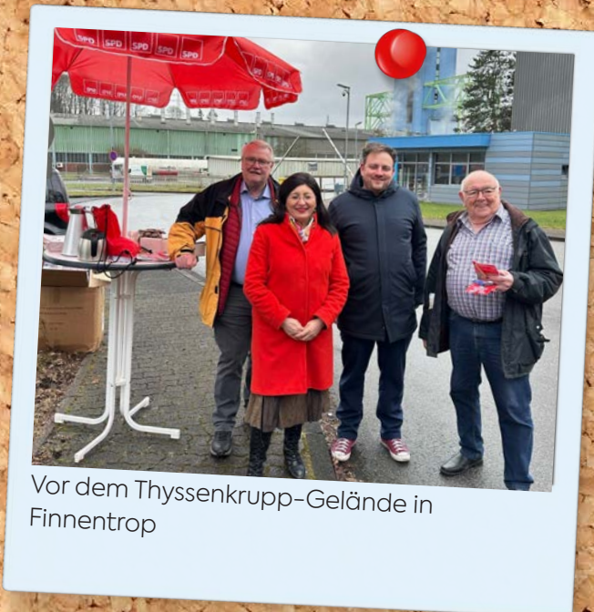
Vor dem Thyssenkrupp-Gelände in Finnentrop