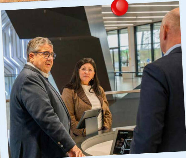
Mit Sigmar Gabriel bei Viega