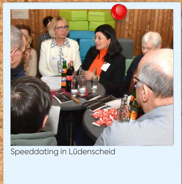
Speeddating in Lüdenscheid