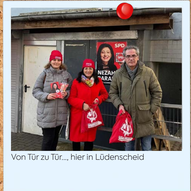
Von Tür zu Tür..., hier in Lüdenscheid