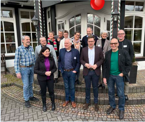
Diskussionrunde beim Waldbauernverband