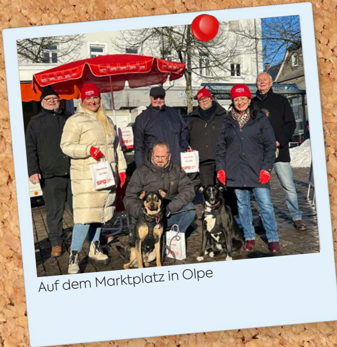
Auf dem Marktplatz in Olpe