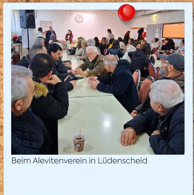
Beim Alevitenverein in Lüdenscheid