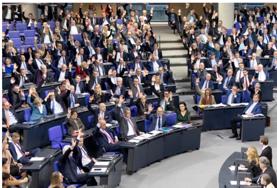
Schluß mit Rechts im Deutschen Bundestag beim Gesetzentwurf zur „Zustrombegrenzungsrichtlinie“ am 31. Januar 2025