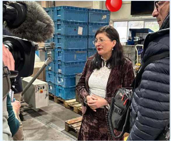
Ein TV-Team des WDR