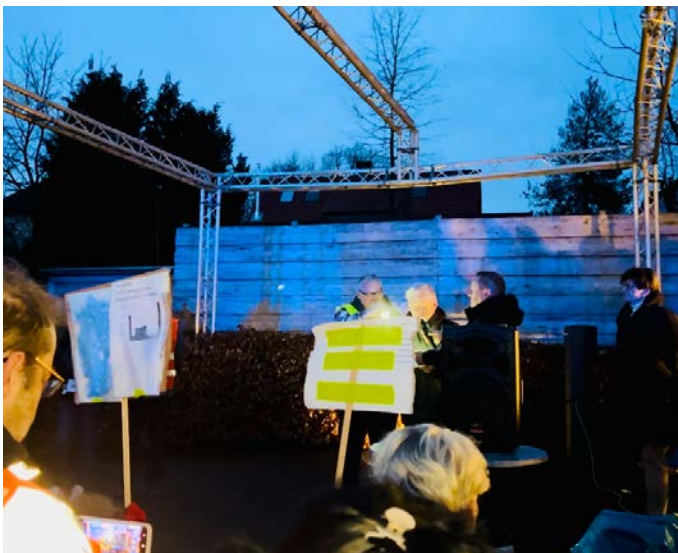
Rechts: In Kierspe Zivilgesellschaft und BM Olaf Stelse