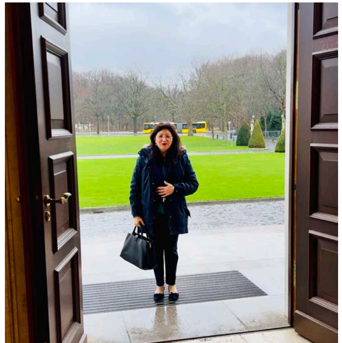
Schloss Bellevue, Eingangsbereich

Auf der UNICEF-Internetseite könnte ihr die UN-Organisation für Kinderrechte und Kinderhilfe unterstützen.