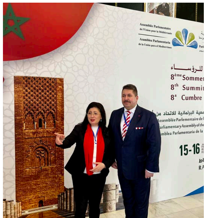
Mit dem luxemburgischen Kollegen