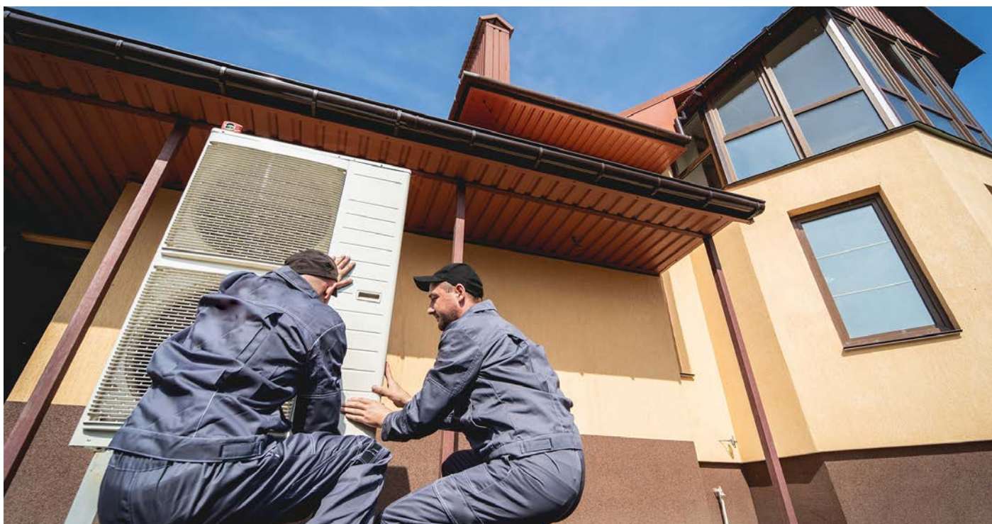
Symbolfoto Wärmepumpe.

D ie KfW hat im Jahr 2023 insgesamt 166 Millionen Euro an Fördermitteln in den Märkischen Kreis und 86,2 Millionen Euro in Kreis Olpe investiert. Damit unterstützt sie die deutsche Industrie, die kommunale und soziale Infrastruktur, die Bildung und die Energiewende.